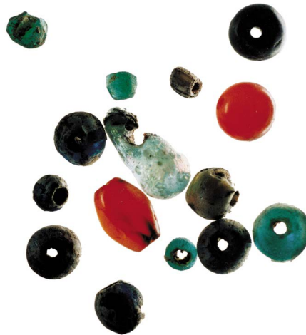
איור 1. מבחר חרוזים ונטיפה.

כפתורים (איור 2: 12, 13; טבלה 2). — נתגלו ארבעה פריטים שהחוקרים מתלבטים בהגדרתם: יש המגדירים אותם כפתורים, ואחרים רואים בהם משקולות פלך, מכסים או חלקי סיכות (לדיון והפניות, ר' Ayalon 2005:22).